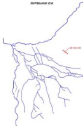
საანგარიშო წერტილი (სმპ 2.04.03-85)

წყალმომარაგების აუტო ნაკვეთის განსაზღვრა 1. წიგნისგან მიღებული საანგარიშო წყლის ხარისხის განსაზღვრა